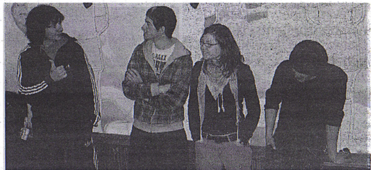
Les élèves sont invités à s'exprimer sur le spectacle et à poser des questions.

teur en scène. Celui-ci souhaitait en effet imaginer « une action pour que chacun retrouve une envie de dialogue, un besoin d'expression » alors que les problèmes comportementaux autour des stades de football se multi-