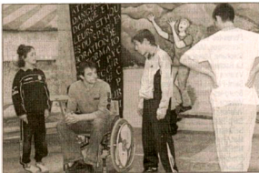
Un spectacle éducatif sur le dopage qui a marqué les esprits.

Le Tambour de la Chamberlière a frappé les trois coups vendredi après-midi pour la représentation qu'ont donné une quinzaine de jeunes du quartier, afin de lutter contre le dopage. Ces enfants, âgés de neuf à douze ans, ont en effet été au centre du spectacle éducatif écrit et réalisé par Stéphane Tournu-Ro-